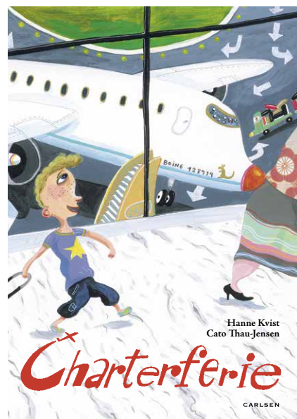
Charterferie. Illustreret af Cato Thau-Jensen. Carlsen 2014.