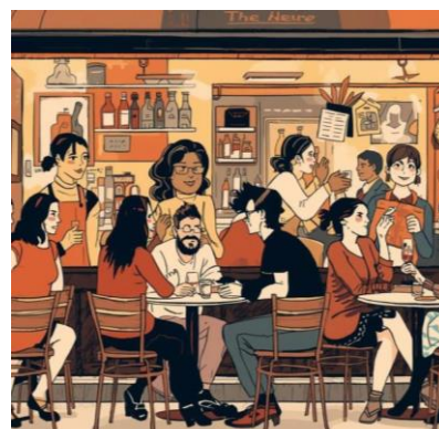
Samtalecafe på Folkehuset i Lystrup