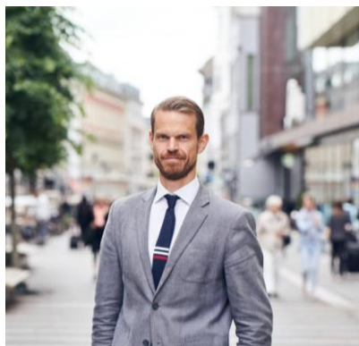
Havde de også ADHD for 10.000 år siden?