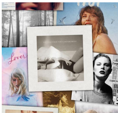
Taylor Swift og litteraturen