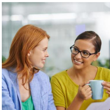
Den Digitale Café